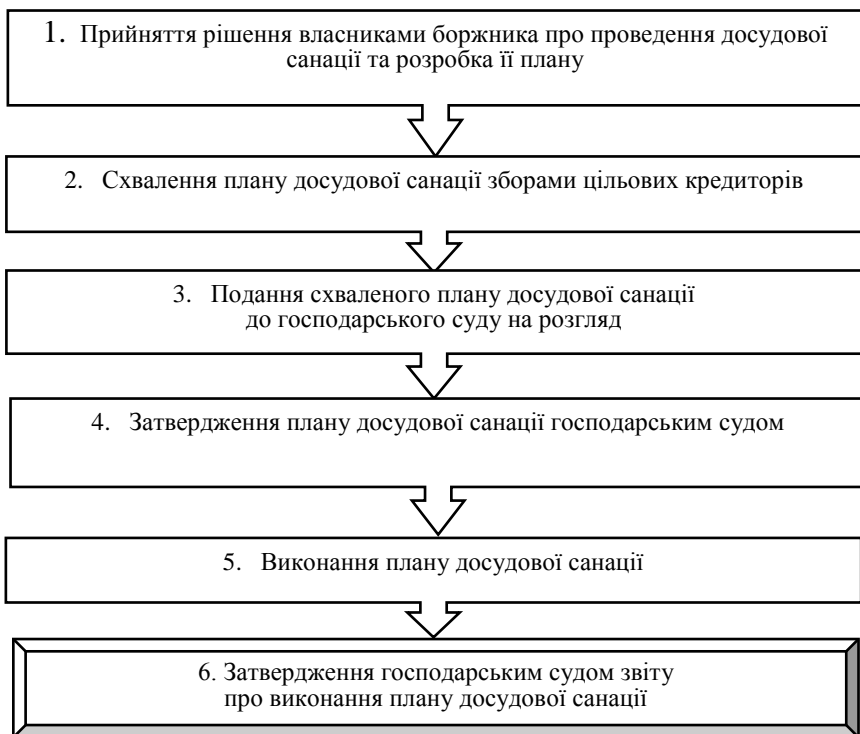
Рис. 2. Процес досудової санації підприємства

• Економія часу для більш оперативної і повної реалізації оздоровчих процедур щодо боржника завдяки мінімізації відносин із господарським судом, у більшості випадків відсутності потреби в зовнішньому арбітражному керуючому. Перед прийняттям рішення про введення процедури санації у рамках відкриття провадження у справі про банкрутство боржника повинні пройти такі обов'язкові стадії, як ініціація банкрутства боржника, ухвала про прийняття заяви до розгляду, підготовче, попереднє та заключне засідання суду, на якому за умови консенсусу й буде прийнято рішення про відкриття саме санаційної процедури.